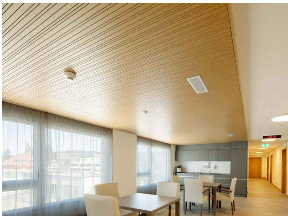
Bernstrasse, Thun .